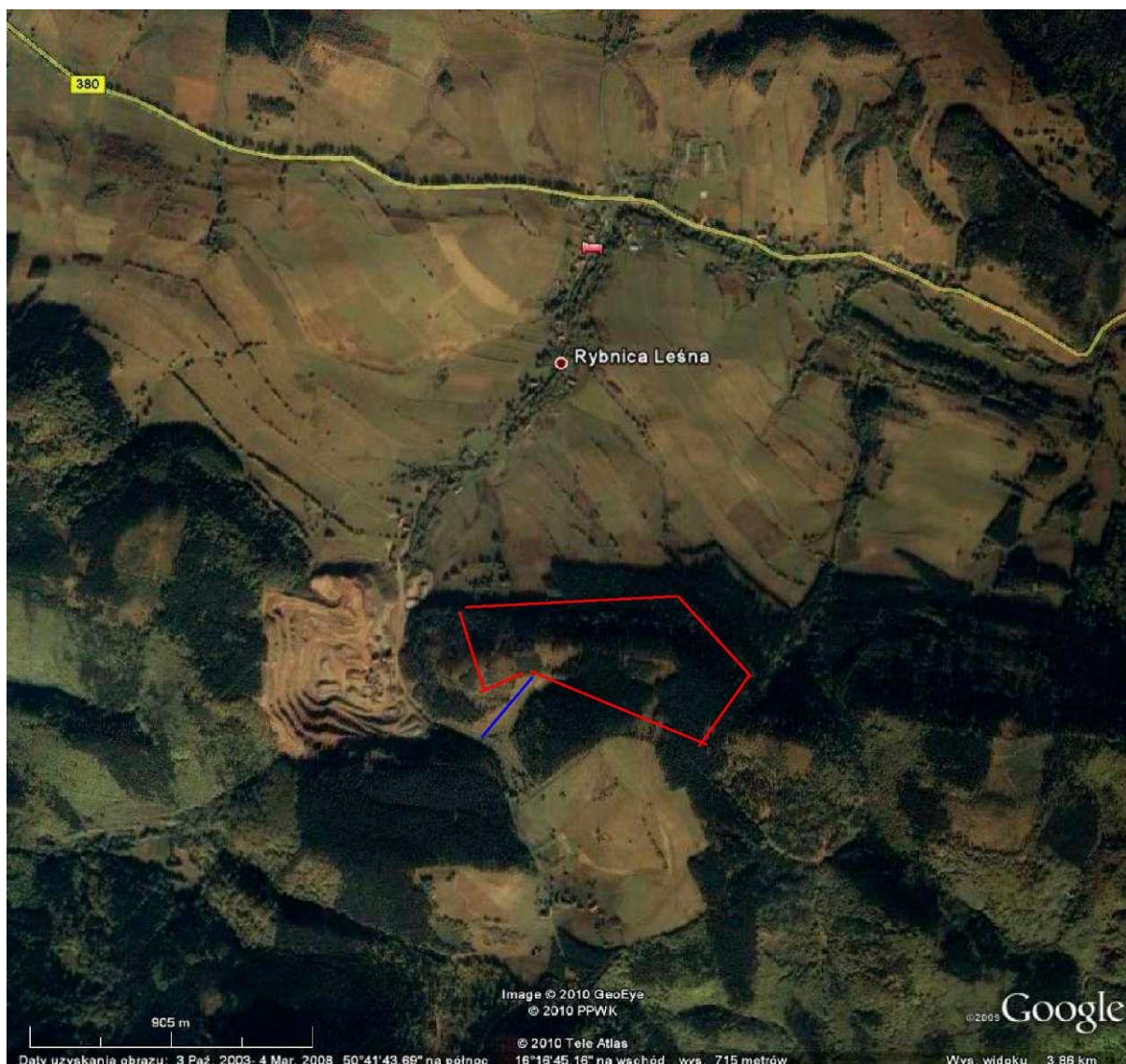
Obr. 1 Umístění důlního území „Rybnica I” - barva červená, dopravní komunikace - barva modrá.