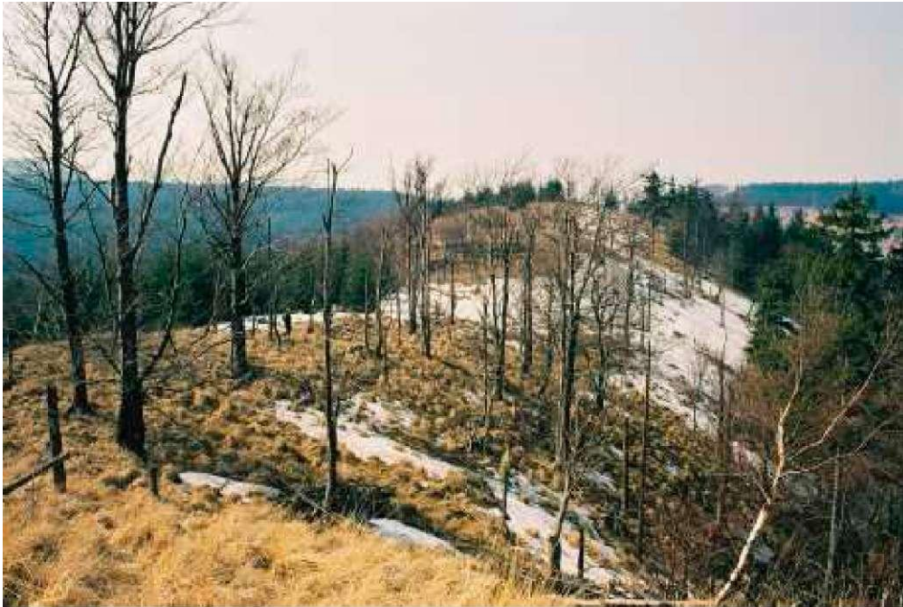
Fot. 1: Střední a západní část ložiska ve vrcholné části hřebene Klinu, zezadu západní vrchol (839 m nad mořem), z pravé strany strmé severní svahy

Na východě se hřeben Klinu spojuje s Turzynou a masívem Jeleńce. Jižní a jihozápadní částí Klinu v oblasti ložiska „Rybnica I” jsou poměrně mírné a kromě lesa zahrnují část luk nad horskou chatou PTTK „Andrzejówka”.