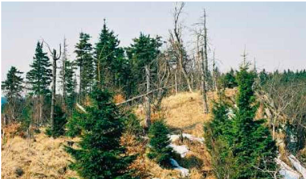
Fot. 2: Severovýchodní, zalesněná část ložiska, kterou je vidět z východního vrcholu hřebene Klinu.