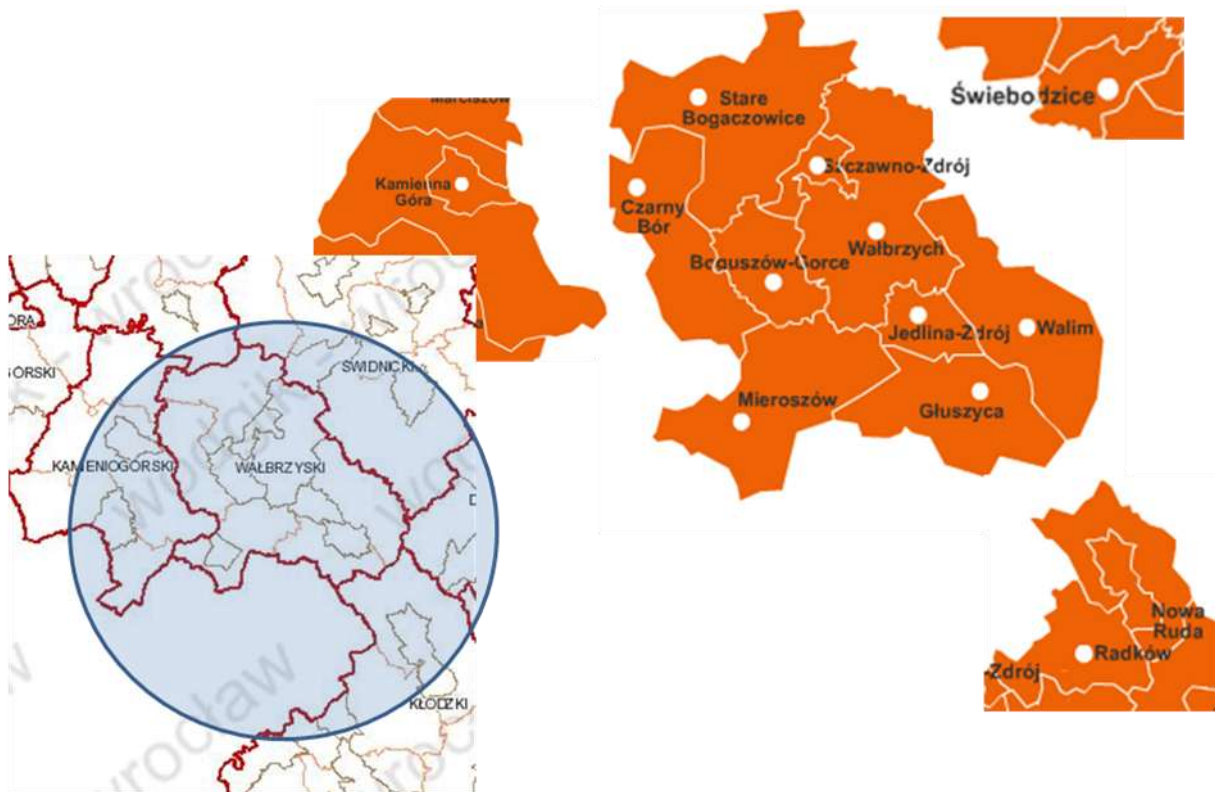
Rys. 1. Położenie gmin Aglomeracji Wałbrzyskiej